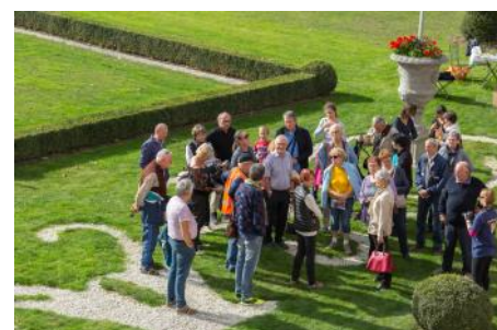
Visite commentée des jardins du château