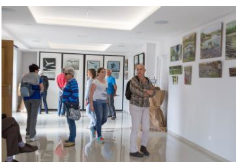
Exposition peinture d'étangs de Dombes par Yolande de Maupeou