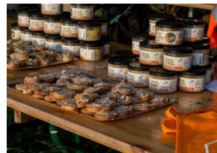
Vente de produits « Poissons »