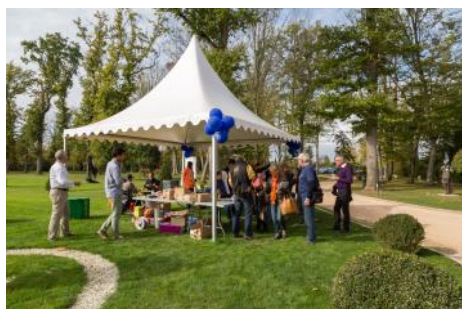
Accueil Dombes Tourisme