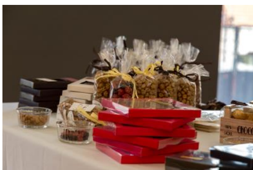
Boutique Gourmande de Marlieux