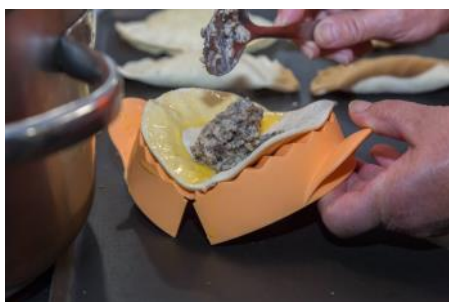
Cours de cuisine de la carpe de Dombes