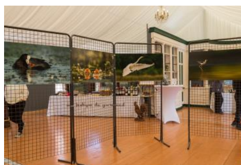
Exposition Photos d'oiseaux de Dombes par Amar Guillem