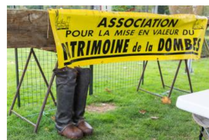
Présentation de matériels anciens de pisciculture par l'association du patrimoine