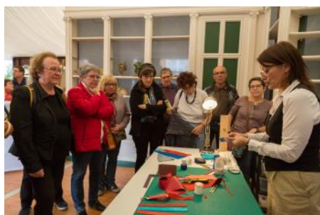
Démonstration de l'utilisation du cuir de carpe de Dombes