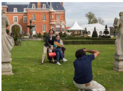
Animation QuenT Photography